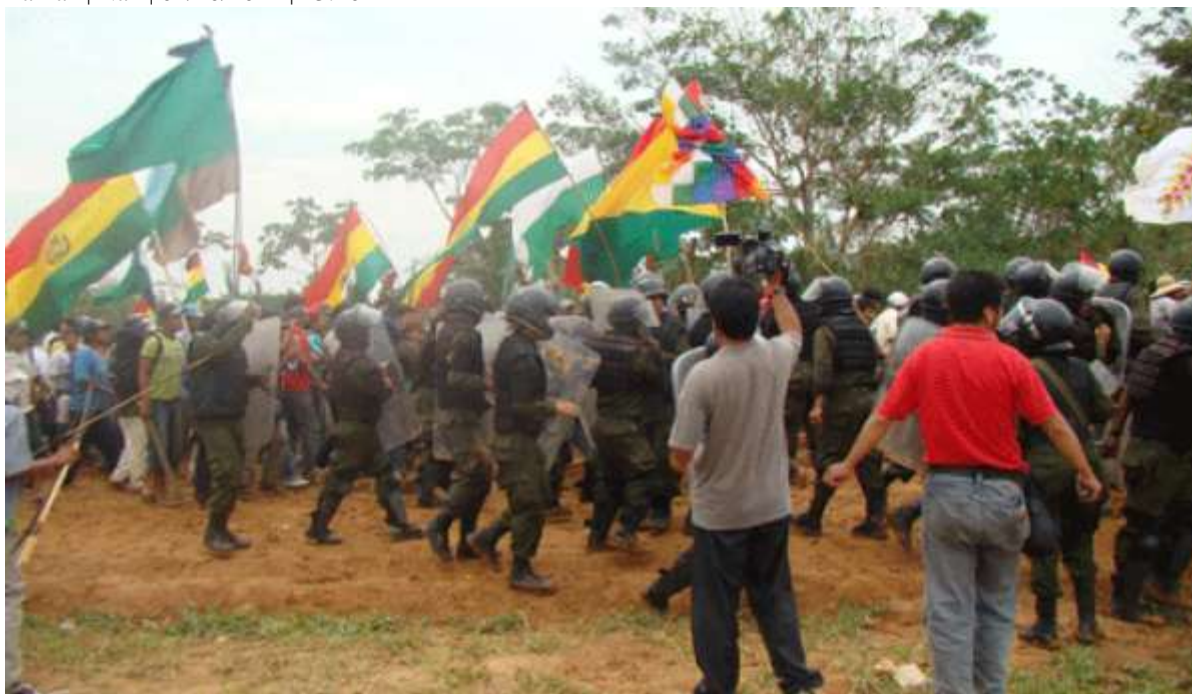
Foto de archivo del despliegue policial en la marcha indígena.

Represión policial contra indígenas en Rurrenavaque.